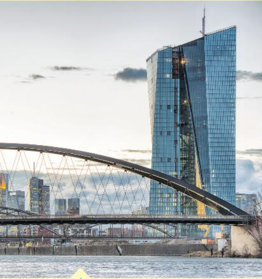
البنك الأوروبي المركزي يقع مقره في فرانكفورت.